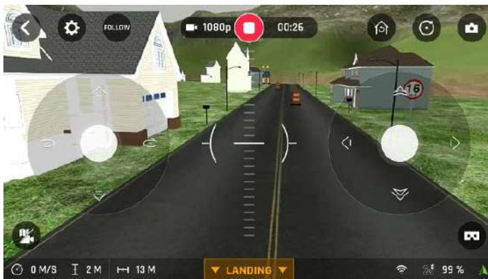
Figure 3 affichage réaliste (Parrot Sphinx)

Les commandes sont les mêmes que sur l'application, de sorte que l'apprenant peut prendre l'habitude de regarder les informations importantes au bon endroit.