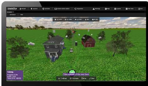
Figure 5 mission photographique (simnet academy)

Les simulateurs fournissent des outils permettant de planifier et de simuler des missions de vol complexes. Les utilisateurs peuvent créer des scénarios virtuels avec des points de passage, des trajectoires de vol et des actions prédéfinies telles que la photographie aérienne. Les pilotes de drones peuvent ainsi s'entraîner et affiner leurs compétences en matière de planification de missions, garantissant des opérations sûres et efficaces dans des situations réelles, afin de se préparer à la photogrammétrie ou à l'expertise.