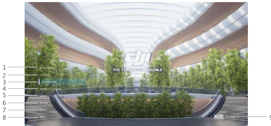
Figure 8 Exemple d'écran principal (DJI)

Seuls la RC et le clavier peuvent être utilisés dans l'écran principal et ses sous-écrans. Une souris ne peut être utilisée que dans certains scénarios spécifiques.