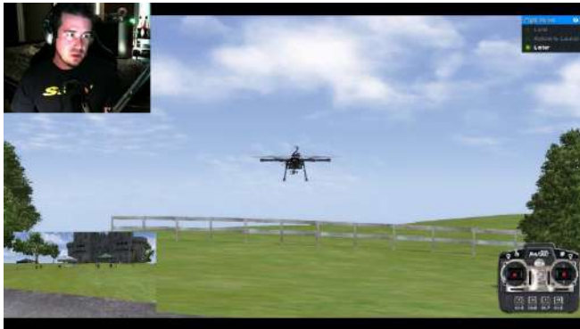
Figure 1 pilotage en visibilité directe

Les simulateurs de vol fournissent une représentation virtuelle très réaliste des caractéristiques de vol et du comportement de différents types de drones civils. Ils intègrent des modèles physiques, aérodynamiques et des systèmes de contrôle précis pour simuler la dynamique de vol du drone. Ce réalisme permet aux utilisateurs d'acquérir une expérience pratique et de développer une solide compréhension de la manière dont les drones réagissent aux différentes commandes de vol.