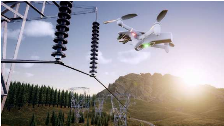
Figure 6 Pilotage à contre-jour (Parrot Sphinx)

Les simulateurs reproduisent diverses conditions environnementales, telles que les conditions météorologiques, les types de terrain et les conditions d'éclairage. Les pilotes de drones peuvent ainsi s'entraîner à différents scénarios, comme les conditions météorologiques défavorables, les vols de nuit ou les vols dans des endroits difficiles. En expérimentant ces environnements simulés, les pilotes peuvent apprendre à adapter leurs techniques de vol et à prendre des décisions éclairées dans des conditions réelles.