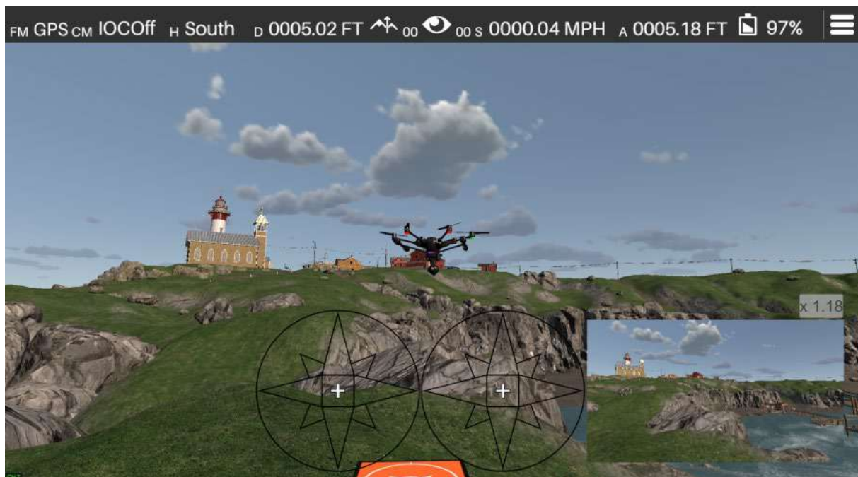
Figure 7 - Dysfonctionnement du drone lors de l'atterrissage avec du vent (simulation Zephyr)

Les simulateurs de vol permettent également aux utilisateurs de s'entraîner à répondre à des situations d'urgence sans les risques inhérents au vol réel. Par exemple, il est possible de simuler des pannes de moteur, des dysfonctionnements des commandes ou des conditions météorologiques défavorables, ce qui permet aux pilotes de développer et d'affiner leurs procédures d'intervention en cas d'urgence et leurs compétences en matière de prise de décision.