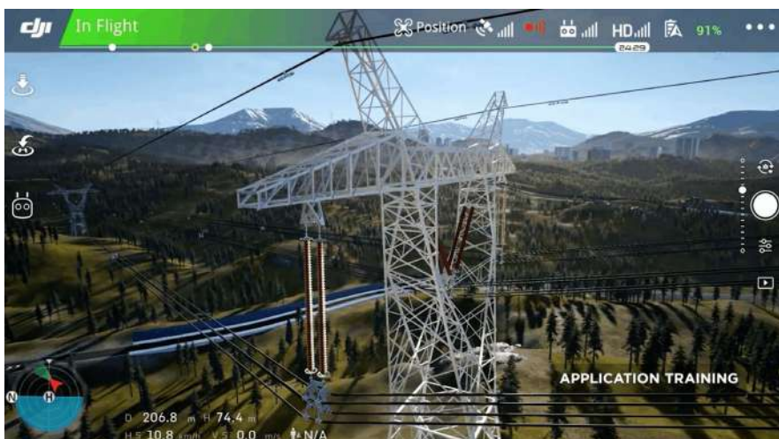
Figure 4 Approche des lignes électriques (DJI)