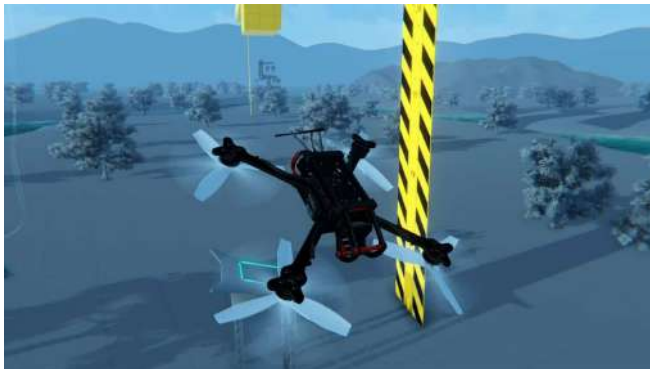
Figure 2 point de vue rapproché ( uavcoach.com DRL sim)

Il est également possible de voir le drone d'un autre point de vue, pour mieux comprendre son comportement.