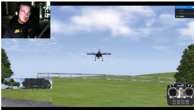
Abbildung 1 Lotsen in Sichtweite (agrilaneta.com)

Flugsimulatoren bieten eine äußerst realistische virtuelle Darstellung der Flugeigenschaften und des Verhaltens verschiedener Arten von zivilen Drohnen. Sie enthalten genaue physikalische Modelle, Aerodynamik und Kontrollsysteme, um die Flugdynamik der Drohne zu simulieren. Dieser Realismus hilft den Nutzern, praktische Erfahrungen zu sammeln und ein solides Verständnis dafür zu entwickeln, wie Drohnen auf verschiedene Flugeingaben reagieren.