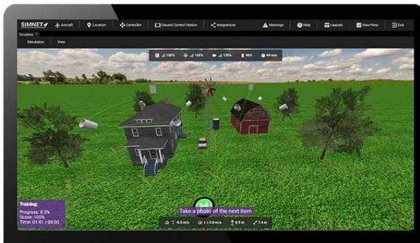
Abbildung 5 fotografischer Auftrag (simnet academy)

Simulatoren bieten Werkzeuge zur Planung und Simulation komplexer Flugmissionen. Benutzer können virtuelle Szenarien mit Wegpunkten, Flugwegen und vordefinierten Aktionen wie Luftaufnahmen erstellen. So können Drohnenpiloten ihre Missionsplanungsfähigkeiten üben und verfeinern, um einen sicheren und effizienten Betrieb in realen Situationen zu gewährleisten und sich auf die Photogrammetrie oder Expertise vorzubereiten.