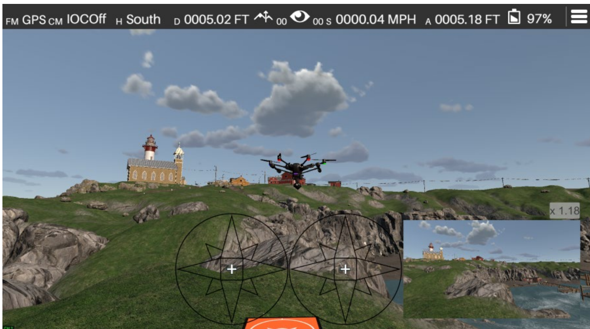
Abbildung 7 Fehlfunktion der Drohne bei der Landung mit Wind (Zephyr-Simulation)

Flugsimulatoren ermöglichen es den Nutzern auch, die Reaktion auf Notsituationen zu üben, ohne die Risiken eines realen Fluges eingehen zu müssen. So können beispielsweise simulierte Triebwerksausfälle, Fehlfunktionen der Steuerung oder ungünstige Wetterbedingungen simuliert werden, so dass die Piloten ihre Notfalleinsatzverfahren und Entscheidungsfähigkeiten entwickeln und verfeinern können.