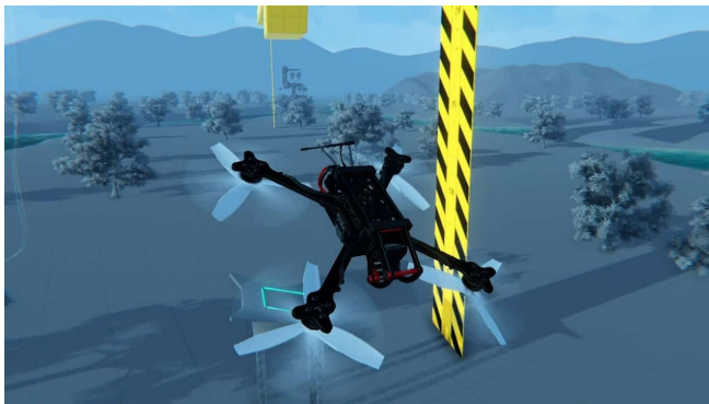
Abbildung 2 Blickwinkel aus der Nähe (uavcoach.com DRL-Simulation)

Es ist auch möglich, die Drohne aus einem anderen Blickwinkel zu sehen, um das Verhalten der Drohne besser zu verstehen.