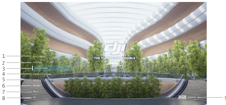
Abbildung 8 DJI Simulator Hauptbildschirm

Dies ist die Seite, zu der der Launcher führt. Auf dieser Seite können Sie sich mit einer Maus ein- und ausloggen, Einstellungen konfigurieren und FAQ und Anleitungen einsehen.