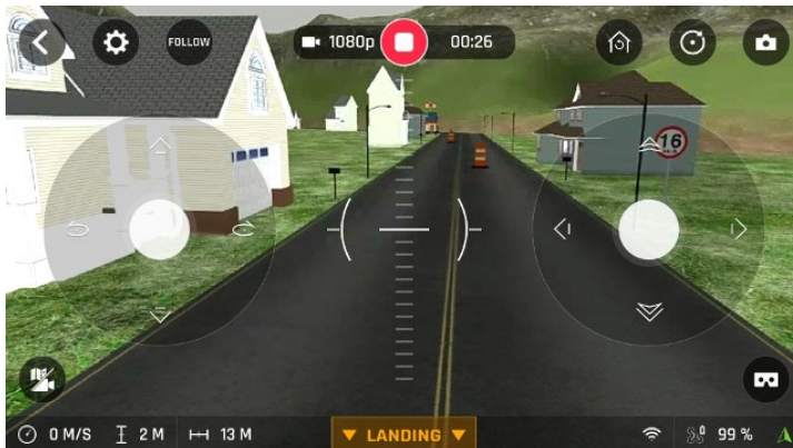
Abbildung 3 realistische Darstellung (Parrot Sphinx)

Die Bedienelemente sind die gleichen wie in der App, so dass der Lernende sich daran gewöhnen kann, wichtige Informationen an der richtigen Stelle zu sehen.