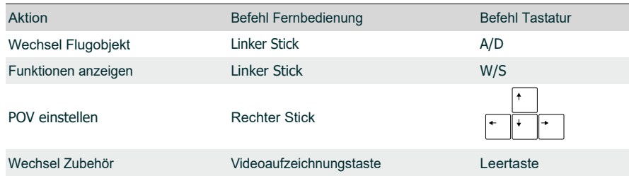
Abbildung 9 Befehle Bedienung und Tastatur