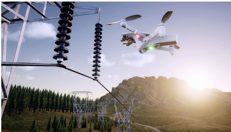
Abbildung 6 Steuerung mit Hintergrundbeleuchtung (Parrot Sphinx)

Die Simulatoren stellen verschiedene Umgebungsbedingungen nach, z. B. unterschiedliche Wetterbedingungen, Geländetypen und Lichtverhältnisse. So können Drohnenpiloten für verschiedene Szenarien trainieren, z. B. für schlechtes Wetter, Nachtflüge oder Flüge an schwierigen Orten. Durch das Erleben dieser simulierten Umgebungen können die Piloten lernen, ihre Flugtechniken anzupassen und fundierte Entscheidungen unter realen Bedingungen zu treffen.